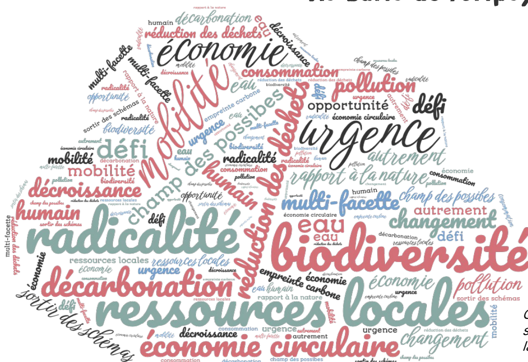
Quelques thématiques saisies au vol pendant la journée.

Le 22 septembre 2023 Au Barlu de Fortpuy, Dissay (86)